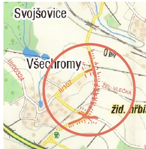
Navržená trasa obchvatu

V pondělí 10.12. proběhlo v této věci jednání na OÚ ve Strančicích svolané projektantem stavby, ke kterému jsem byl přizván. Řešilo se především křížení obchvatu s vlečkou, s cyklostezkou, umístění zastávek a návaznost na budoucí řešení obchvatu. Vzhledem k tomu, že se na jednání nedostavil nikdo za investora (Středočeský kraj), nemohl být na jednání učiněn žádný závěr. Projektant stavby však přislíbil, že s obcí bude při přípravě stavby nadále spolupracovat. (PS)