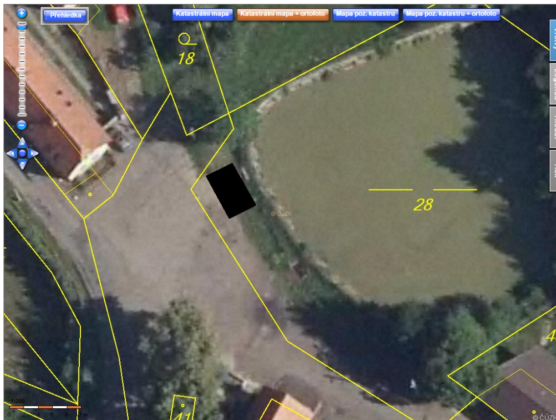
Mapka navrhovaného umístění boxu

Návrh usnesení: Zastupitelstvo obce Strančice ukládá starostovi zajistit výstavbu nového boxu na kontejnery na tříděný odpad s kapacitou 8 kontejnerů dle návrhu Osadního výboru Všechem.