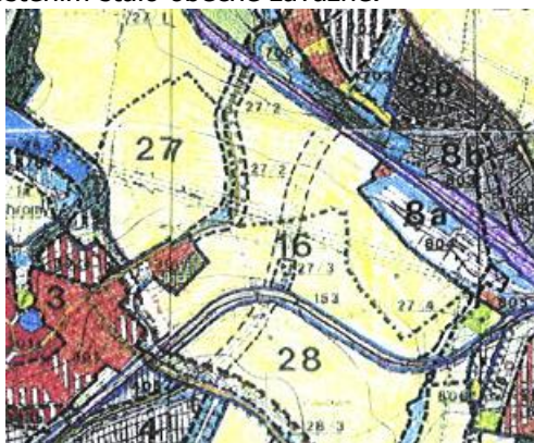
Původní řešení ÚPO – 2003

V původním územním plánu obce (ÚPO) z roku 2003 bylo navrženo vedení silnice II/107 od křižovatky u Všechrom rovně na severovýchod a přemostěním přes trať dále na křižovatku u sila. Po obdržení informace o plánovaném rozšíření a prohloubení stávajícího podjezdu pod trať na Svojšovice navrholo tehdejší vedení obce změnit směr obchvatu obloukem za statkem Jandových na stávající silnici ze Všechrom do Svojšovic pod upravený podjezd pod trať. V té době byl již zpracován koncept územního plánu velkého územního celku (ÚP VÚC) Pražský region, který sice obsahoval původní řešení s přemostěním trati, ale protože koncept není obecně závazný, vydal krajský úřad souhlas s navrženou změnou č. 2 ÚPO. Po schválení ÚP VÚC v roce 2006 se však v něm obsažené řešení s přemostěním stalo obecně závazné.